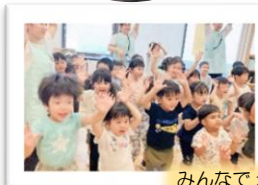
みんなで zoo っと体操を踊ったり