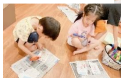
パパやママにお手紙 を書きました