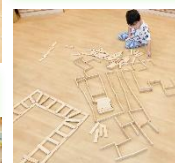
どこまで高く積めるかなあ