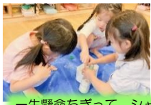
一生懸命ちぎって、シャカシャカ振って