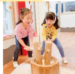
とってもいいお顔の4歳児さん☆