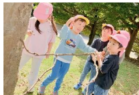
外で思いっきり走ったり、自然と触れ合って