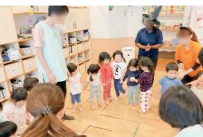
英語の先生とハロウィンを楽しむ