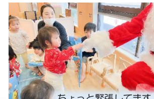
ちょっと緊張してます