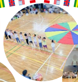
4歳児さんのバルーン 様々な技を披露してくれました