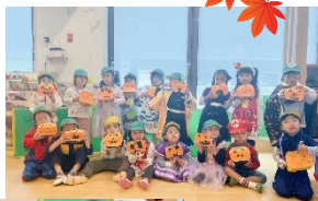
ハロウィンのお菓子入れ。いろんなお顔のが、できました。

生活発表会で発表する内容は、日々保育の中でチャレンジしてきたことをお家の方に見てもらいたいと楽しみにしています。