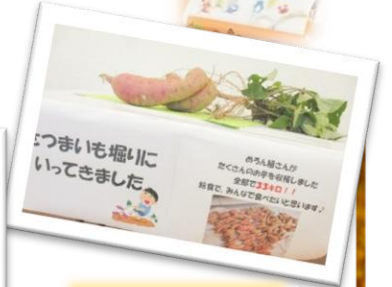
33kgも美味しうなお芋を収穫してきてくれました♪

4 歳児 5 歳児はバスに乗って、水族園まで遠足に行きました☆自分たちの好きなおやつを持っての遠足なので、登園時からわいわい♪とても楽しみにしているのが、よ〜く分かりました。