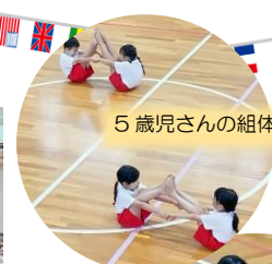
5歳児さんの組体操