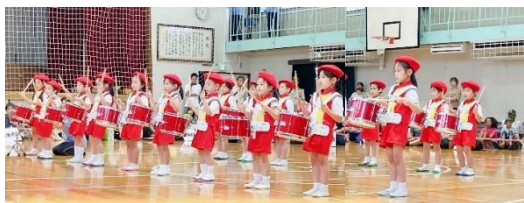
5歳児さんの鼓笛で、今年度の運動会がスタートです