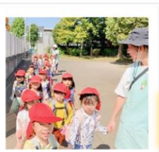
天気に恵まれ、お散歩日和