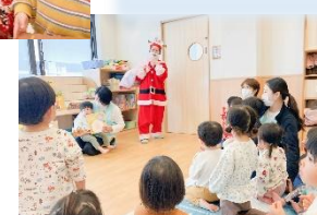
12月生まれのお友だちは多いので、乳児さんと幼児さん別々に行いました。