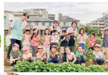
園長先生からおやつをもらって、エネルギー補給。帰りもしっかり歩いて帰ることができました。