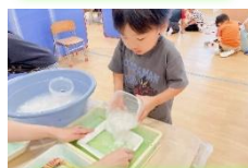
すくって、トレーに入れて、ぎゅっぎゅっ