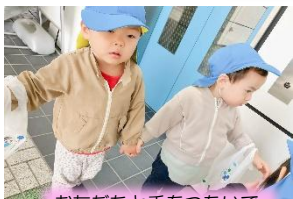
お友だちと手をつないで