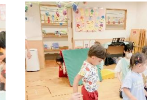
ビルドインバランスもスイスイ