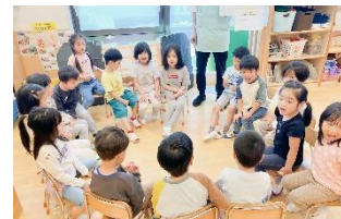
年長さんの子ども会議も板についてきて、発言したり、お友だちの意見も聞いたり、まとまってきました。