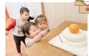
かがみもち〜と1歳児さん☆