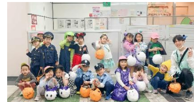
ハロウィンのお菓子入れを、風船を膨らませて型を作り、各々飾り付けました。