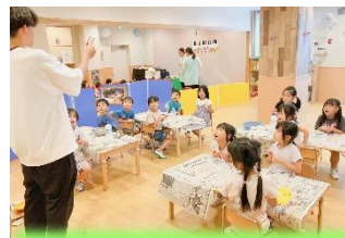
わくわく♪ 先生のお話をしっかり聞いています。