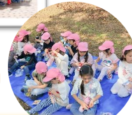
楽しみにしていた『おやつ』☆