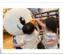
お別れのハグをしてもらいました。