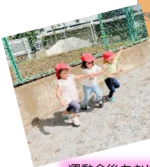
運動会後もかけっこ大好き