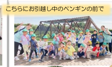
こちらにお引越し中のペンギンの前で