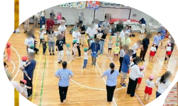
親子で、「ディズニー体操」 みんなで準備体操です