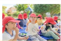
おやつでは、さらにニコニコ☆