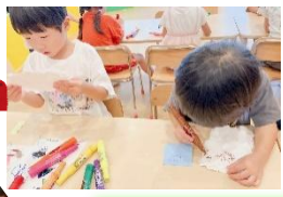
真剣に書いています