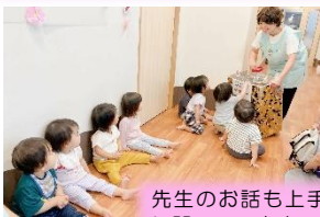
先生のお話も上手に聞いています