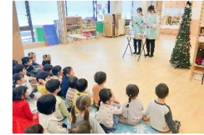
先生のハンドベルの演奏に聞き惚れて♪ 憧れのまなざし