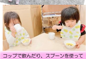
コップで飲んだり、スプーンを使って