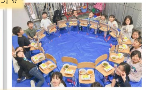
お昼は、保育園に戻って、給食先生がその日の給食をお弁当に詰めてくれたのを、輪になって頂きました♪