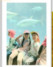
水の生き物たちに興味津々