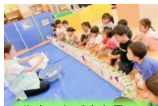
先生のお手本を見て

紙すきに挑戦して、ハガキを作りました。 ひらがなを覚え中の4歳児さんは文字を使って、 まだ難しいお友だちは絵を描いて、パパやママ、 おじいちゃんおばあちゃんにお手紙を書きました。