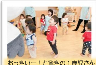
おっきいー！と驚きの1歳児さん