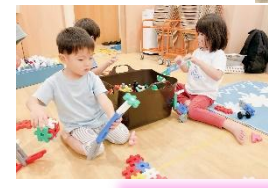
想像力を膨らませて