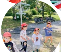
しゃぼん玉をしたり、滑り台をしたり♪