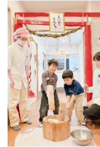
みんなで協力して行動できる5歳児さん☆